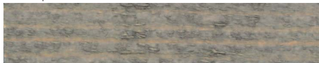
7365 vulkánová šedá