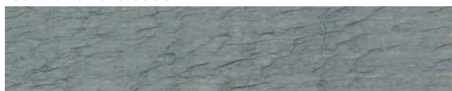
7370 azurová šedá