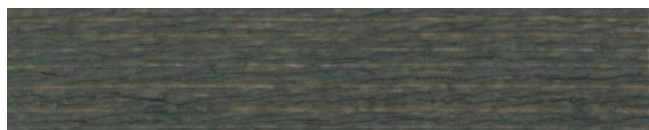
7380 křemenová šedá