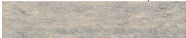
7360 alpská šedá