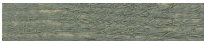
7375 antická šedá